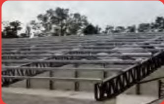
Correas de Galpones

Estos productos se utilizan en la construcción metálica liviana, especialmente en estructuras de naves industriales y para usos agropecuarios. Constituye una solución novedosa en estructuras para viviendas y locales comerciales, reduciendo costos ya sea en materiales como mano de obra.