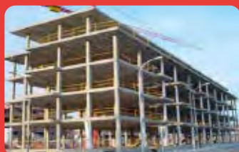
Estructura de Hormigon