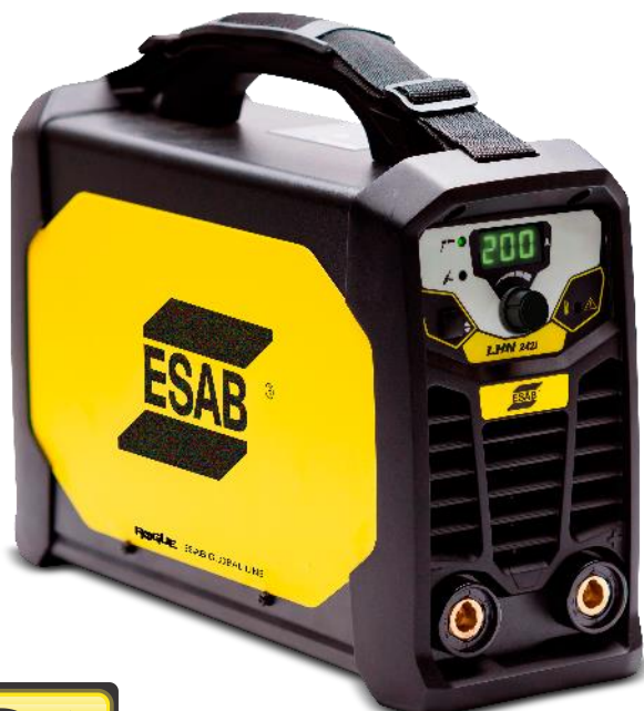
Rogue LHN 242i