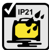
LLUVIA Y POLVO

Todos los equipos de ESAB pasan las pruebas más rugosas.