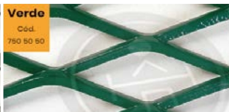
Verde Cód. 750 50 50