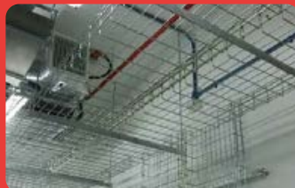
Bandeja Porta Cable