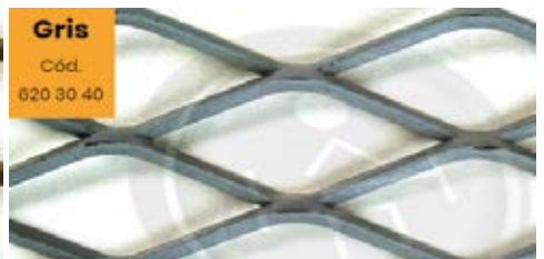
Gris Cód. 620 30 40