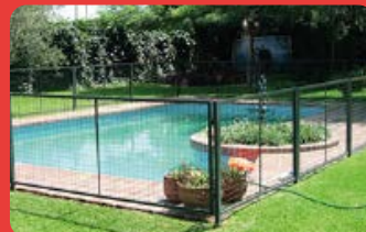
Cercos para Piletas