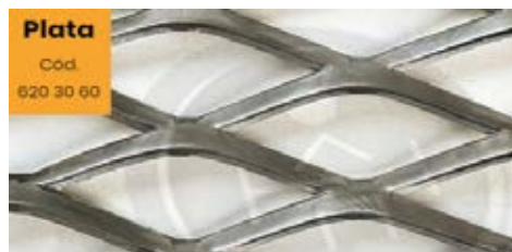
Plata Cód. 620 30 60