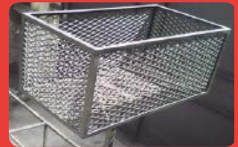
Canastos y Racks